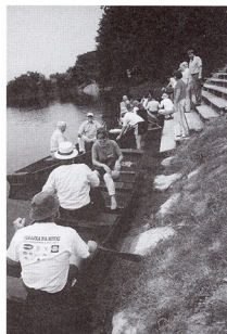
Mednarodna komisija na čolnih