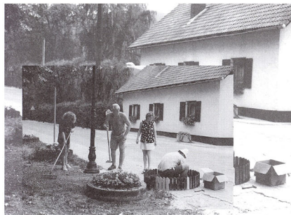
Urejanja mest smo se lotili vsi krajanj