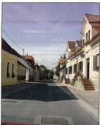
Veliki park, Slika kulturne, je vseh letov predstavitelj trdnih magistrat in območinski osnati in cvetlično okraševati.