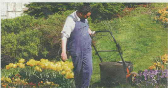
Kamnik je dobil lepšo podobo.

Zaključna prireditev in razglasitev rezultatov bo v Cardiffu v Veliki Britaniji od 25. do 27. septembra 2009, ko bodo razglasili rezultate tekmovanja za leto 2009 in podelili medalje najbolj uspešnim tekmovalcem.