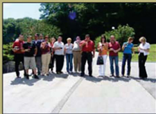
Prvi postanek so imeli udeleženci generalke v pivovarni Haler, kjer so nazdravili z njihovim pivom.

Člani odbora, ki skrbijo za pripravo tekmovanja evropskih vasi v Olimju, so v minulih mesecih imeli kar nekaj skupnih posvetov. In ker je samo tekmovanje že skoraj pred vrati, so se skupaj s slovenskimi ocenjevalci podali na isto pot, kot jo bo 11. julija obiskala mednarodna komisija. Ocenjeval-