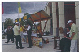
Šentjernejska društva so se izkazala s predstavitvijo. Na sliki čebelarji in predica.