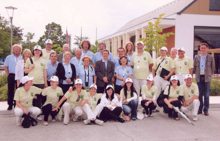
Entente Florale Europe 2010 - Šentjernej, 18. in 19. junij