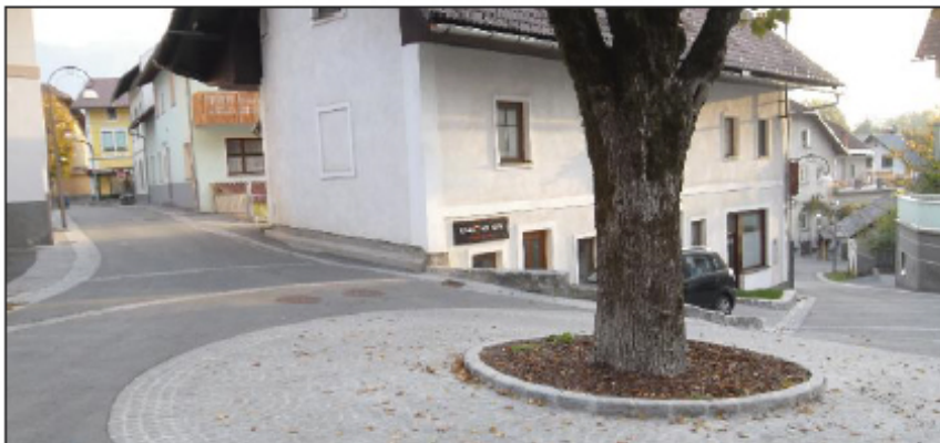
Obnovljeno jedro Bleda, vas Grad.

Evropska ocenjevalna komisija Entente Florale Europe je med drugim pohvalila razvojni pristop, saj da so vsi planski dokumenti pred sprejetjem ustrezno predstavljeni javnosti. Opazila je, da si občina zelo prizadeva ohranjati stara vaška jedra, ki so lepa, urejena in čista, prav tako je pohvalila grajski kompleks, ki da je zgledno urejen in vreden ogleda, še posebej pa so pohvalili novo pešpot skozi gozd z »zelo harmonizirano varovalno leseno ograjo«. Biser Bleda predstavlja Otok, pohvalili so nov zbirni center za odpadke skupaj s čistilno napravo, urejeno in vzdrževano mestno pokopališče, urejene zasebne vrtove, okoljsko izobraževanje mladih, pohvalili so veliko število društev, ki prav tako ogromno naredijo za splošen izgled Bleda.